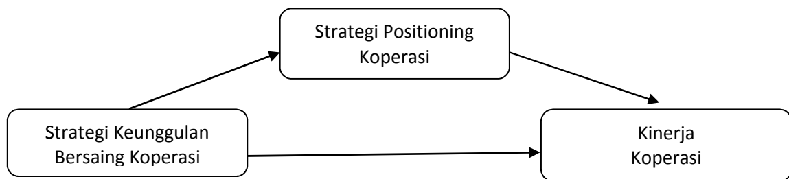
Gambar 2. Kerangka Pemikiran “Hubungan Strategi Keunggulan Bersaing dan Strategi Positioning terhadap Kinerja Koperasi”

keunggulan bersaing terhadap kinerja melalui keunggulan positioning. Keterampilan yang superior, sumberdaya yang superior, pengendalian yang superior merupakan keunggulan bersaing sebagai variabel bebas dan kinerja sebagai variabel terikat. Nilai konsumen yang superior dan biaya yang relatif lebih rendah merupakan keunggulan positioning sebagai Variabel Intervening (mediasi). Pada saat keterampilan, organisasi, sumberdaya yang digunakan untuk memperoleh nilai/atau efisiensi biaya, keunggulan posisi telah menuju pada prestasi dari hasil akhir (Cravens, 1996).